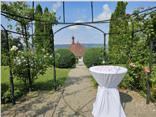
Rosengarten bis 120 Personen