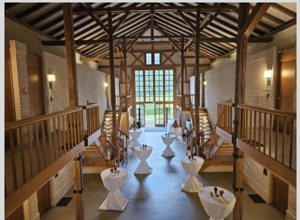
Schürhalle bis 120 Personen