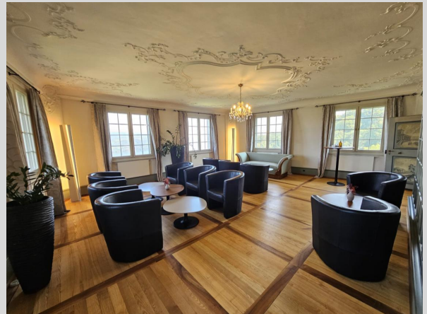
Kaminzimmer/Bibliothek mit oberem Stock bis 120 Personen