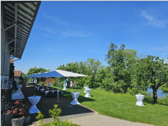
Terrasse Restaurant bis 120 Personen

Findet im Anschluss eine Feier statt, entfallen die Kosten.