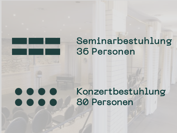
Aula — 120m 2 bis 80 Personen