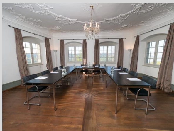
Festsaal — 40m 2 bis 20 Personen