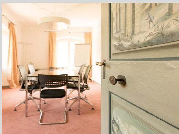
Gruppenräume — 22-30m 2 6 bis 10 Personen