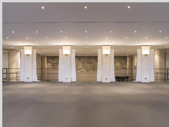
Foyer — 110m 2 bis 40 Personen