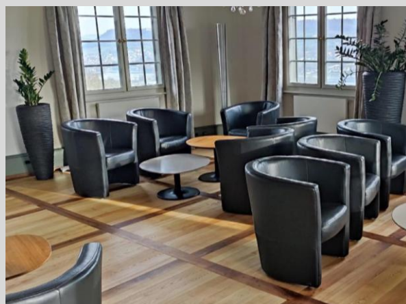
Bibliothek/Kaminzimmer — 37/24m 2 10 / 20 Personen