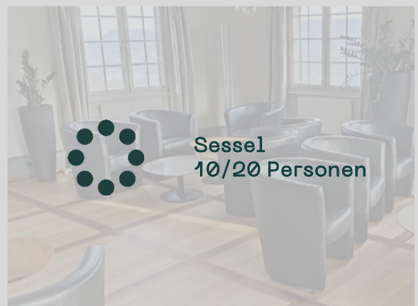
Bibliothek/Kaminzimmer — 37/24m 2 10 / 20 Personen