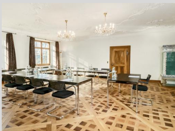
Plenarsaal — 56m 2 16 bis 40 Personen