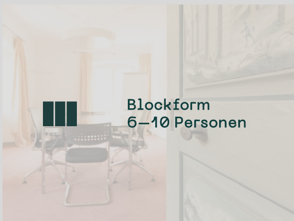
Gruppenräume — 22-30m 2 6 bis 10 Personen