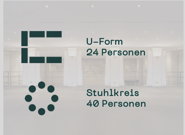
Foyer — 110m 2 bis 40 Personen