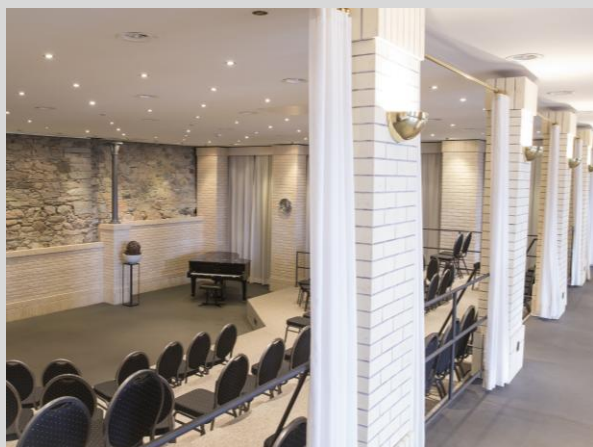
Aula — 120m 2 bis 80 Personen